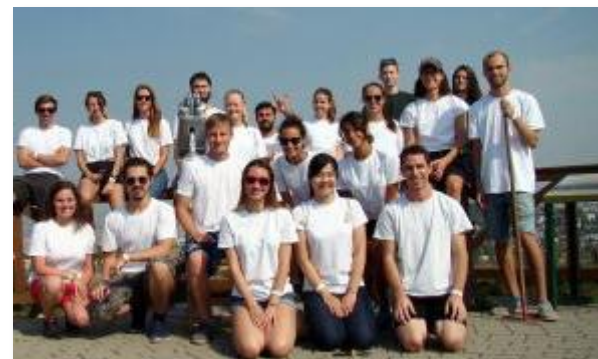
ブタペスト工科経済大学 (ハンガリー)