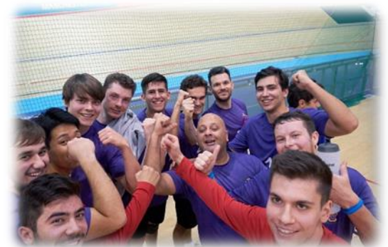
マンチェスター大学 (イギリス)