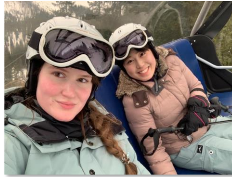
ミュンヘン大学 (ドイツ)