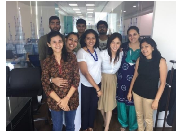
インド・NGOでのインターンシップ