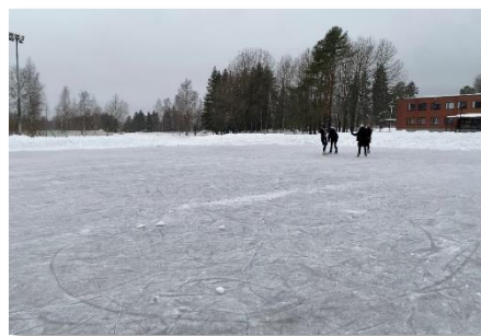
ローレア応用科学大学 (フィンランド)