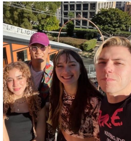
ワイオミング大学 (アメリカ)