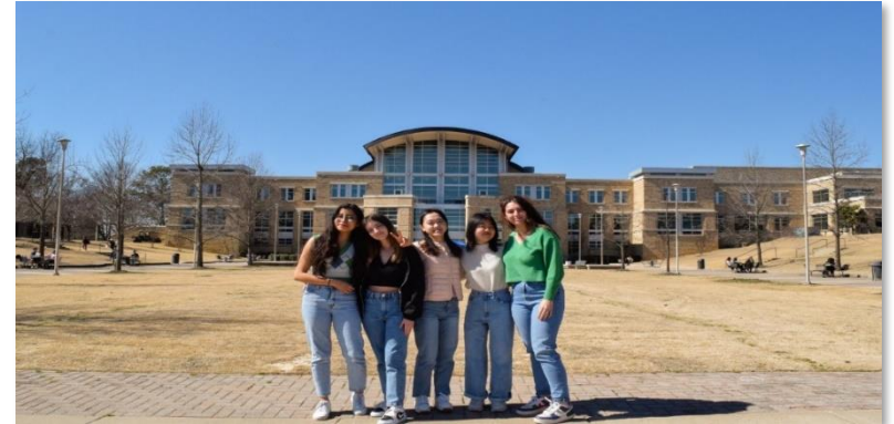
アーカンソー州立大学 (アメリカ)