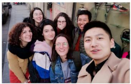
トリノ大学 (イタリア)