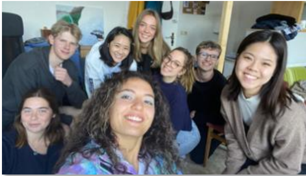
ブランデンブルク工科大学 (ドイツ)