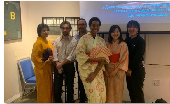
マサチューセッツ大学ボストン校 (アメリカ)