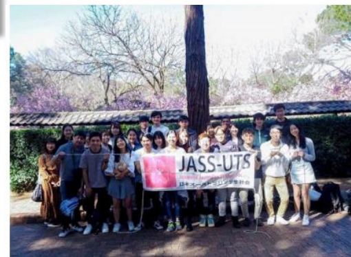
シドニー工科大学 (オーストラリア)