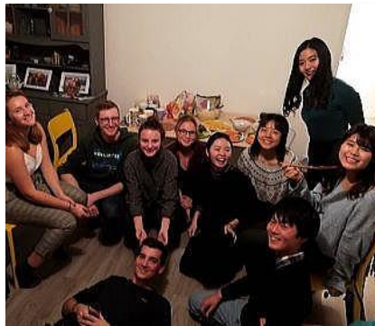
リール政治学院 (フランス)